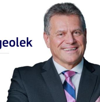
Valdis Dombrovskis Volinik Majandus ja tootlikkus Rakendamine ja lihtsustamine

Kaubandus ja majandusjulgeolek Institutsioonidevahelised suhted ja läbipaistvus